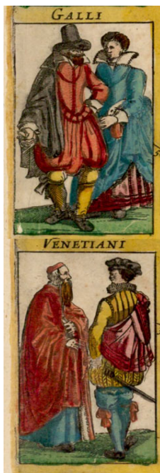
Illustr. : J. Jansson- J. Hondio, Nova Europae Descriptio, Amsterdam, 1638